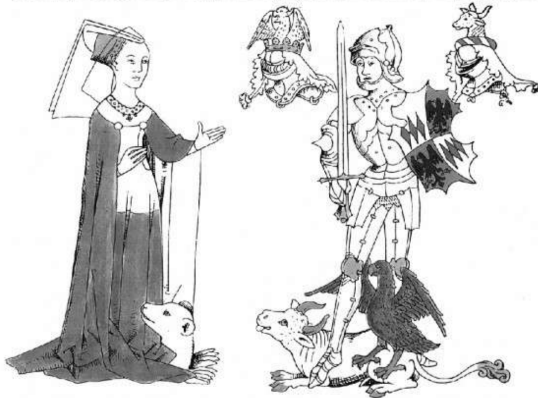
Richard Neville, conte de Warwick, „făuritorul de rege”, și soția sa, Anne Beauchamp, în Rous Roll